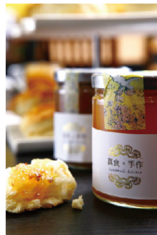
國際獎項三星主廚親自研發

「創作料理第一個要素一定是好吃；天然無添加飲食， 不該等於清淡、沒感受的食物，要靠著信仰才吃得進去。」