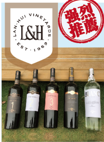
蘭輝加烈酒(右二) 榮獲2019 亞洲葡萄酒指南銅牌獎

Whatever is worth doing is worth doing well. 任何值得做的事就值得把它做好！